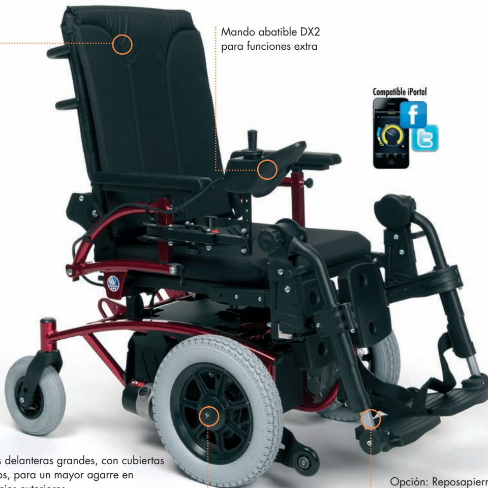
Mando abatible DX2 para funciones extra