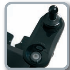
Mando abatible LE - Sólo para modelos estándar