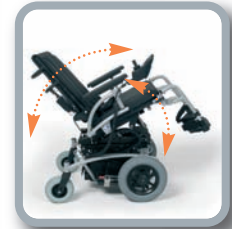
Basculación y reclinación eléctrica (opcional)