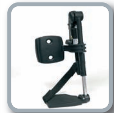
Optional: BZ7-E reposapiernas elevables eléctricos