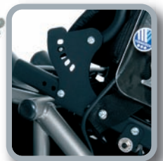
Asiento y respaldo reclinable manualmente