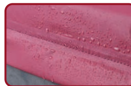
Funda impermeable al agua

*Los defectos o desperfectos debidos a una incorrecta utilización o manipulación del material o los desgastes producidos por un uso normal del mismo, no se incluyen en esta garantía.