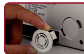
Filtro de aire